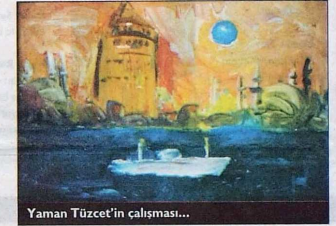
Yaman Tüzcet'in çalışması...