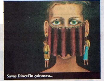
Savaş Dinçel'in çalışması...