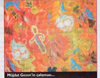
Müjdat Gezen'in çalışması...